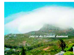
Abbildung 11 | In dieser Phase hat die Dynamik wieder die Oberhand gewonnen. Die Thermik wird fast gänzlich unterdrückt (siehe weiter Abbildung 12).