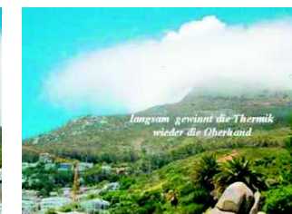
Abbildung 12 | Jetzt kommt die Thermik wieder stärker zur Geltung und durchsetzt die dynamische Strömung mit aufwärtsgerichteter Vertikalbewegung.