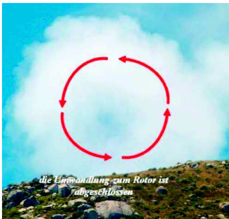
Abbildung 7 | Die ehemalige Cu-Wolke ist zum Rotor umgebildet. Die Strömung rotiert um eine horizontale Achse quer zur Strömung. Es ist mit gefährlicher Turbulenz zu rechnen.