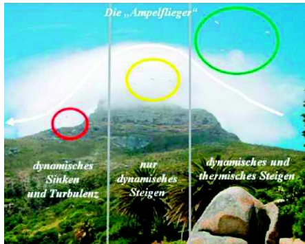
Thermik im Luv verstärkt das dynamische Steigen Abbildung 1 | Die „Ampel“ steht auf grün, wo Thermik und Dynamik gleichzeitig vorkommen und in gleicher Richtung wirken. Hier ist die aufwärtsgerichtete Vertikalbewegung am besten entwickelt und am wenigsten turbulent. Auf gelb steht die „Ampel“ praktisch dort, wo „nur“ dynamisches Steigen vorkommt. Das ist in diesem Beispiel am Gipfel des Berges. Der rote Bereich der „Ampel“ wird durch absinkende Vertikalbewegung und Leeturbulenz dominiert. Hier wird die thermische Aufwärtsbewegung durch das dynamische Sinken unterdrückt, außerdem kann sich gefährliche Leeturbulenz entwickeln.

Die folgenden Abbildungen sollen die oben aufgeführten Postulate anschaulich dokumentieren.