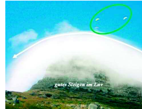
Nur dynamischer Aufwind im Luv ohne Thermik Abbildung 3 | Wenn es beim Überströmen eines Hindernisses nicht zur Ausbildung von Thermik kommt, dann ist das Steigen im Luv am besten ausgeprägt.