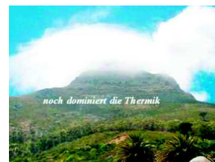
Abbildung 10 | Auf diesem Bild sehen wir eine Phase in der die Thermik sowohl im Luv als auch im Lee dominiert. Im Lee ist auch hier die Ausbildung einer Rotorwolke im Ansatz zu erkennen (siehe weiter Abbildung 11).

selenspiel hatte im Zeitraum der stärksten Sonneneinstrahlung etwa eine zeitliche Frequenz von 30 Minuten. Erst am Tagesende, als die Thermik merklich nachließ, wurden die Perioden der dynamischen Dominanz länger, bis die Thermik gar nicht mehr zum Zuge kam. ◀