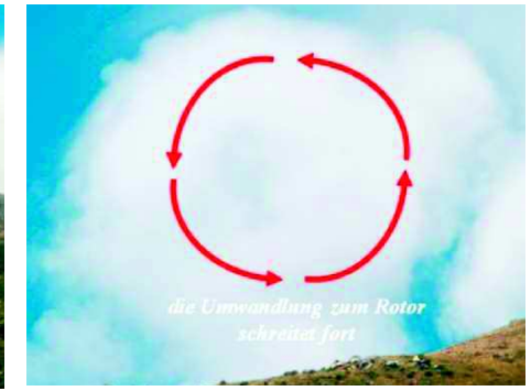
Abbildung 6 | Die Strömungsrotation nimmt ständig zu, man erkennt es deutlich an der weiteren Umwandlung der Wolke zur Rotorwolke (siehe weiter Abbildung 7).