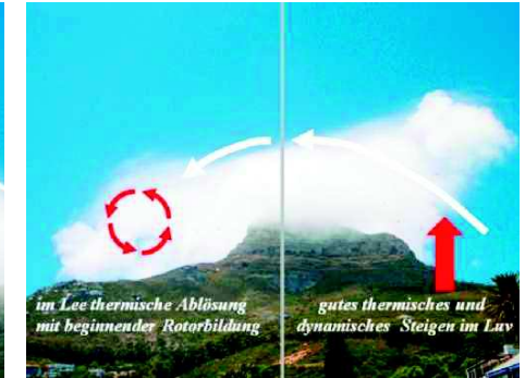
Entwicklung von Rotoren aus der Interaktion zwischen Dynamik und Thermik im Lee eines Hindernisses Abbildung 4 | Im Luv addieren sich thermisches und dynamisches Steigen, es herrschen gute Bedingungen für einen Thermikflug. Im Lee steigt ebenfalls eine Thermikblase auf, da der Wasserdampf bereits kondensiert ist, wird eine Cu-Wolke sichtbar. Die aufwärtsgerichtete Vertikalbewegung der Thermik wird von der abwärts gerichteten dynamischen Vertikalbewegung nicht nur unterdrückt, sondern auch durch Rotation versetzt, die sich im weiteren Verlauf verstärkt (weiter siehe Abbildung 5).