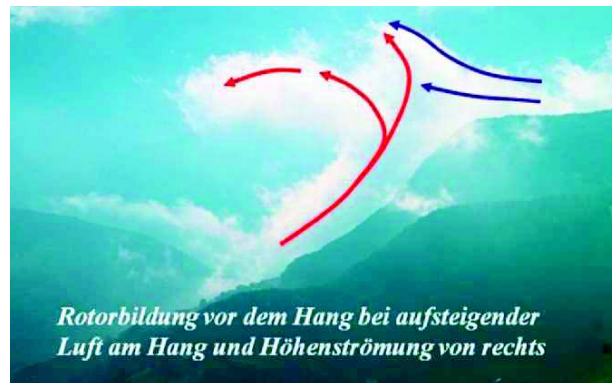
Abbildung 9 | Hier bildet sich gerade eine Rotorwolke im Lee eines Hanges. Die aufsteigende thermische Bewegung wird durch die von rechts kommende Höhenströmung abgelenkt und in Rotation versetzt. Die gefährliche Leeturbulenz wird durch das Vorhandensein von Wolken gut sichtbar.