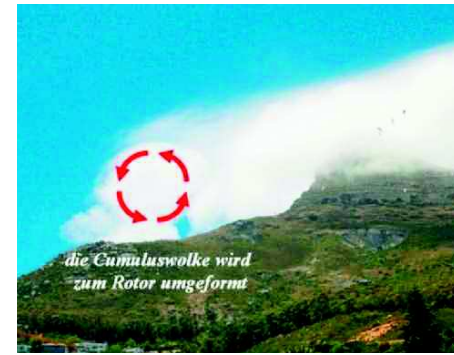
Abbildung 5 | Jetzt ist die Cu-Wolke sehr deutlich zu erkennen. Durch die rotierende Bewegung wird die Cu-Wolke mehr und mehr „kugelförmig“ und entwickelt sich weiter zu einer Rotorwolke (siehe weiter Abbildung 6).