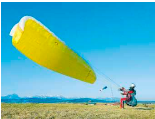
Wenn sich die Kappe harmonisch gefüllt hat, stellt sich der Schirm ohne weiteres Zutun auf. Die Geschwindigkeit der Kappe wird über den Druck des Körpers gesteuert. Versierte Piloten können in den knapp 3 Sekunden der Aufstellphase bereits die Blickkontrolle von Kappe und Leinen durchführen.