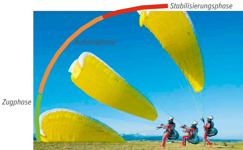
Anfangs liegt die Kappe ca. 7 Meter vom Piloten entfernt. In der Zugphase wird Energie zugeführt und die Kappe steigt fast senkrecht. In der Aufstellphase steigt sie schräg nach oben. Im letzten Drittel kommt die Kappe schnell auf den Piloten zu und muss daher über ihm stabilisiert werden

Hüfte und des Oberkörpers kann so der eine oder andere Schritt rückwärts gespart werden.