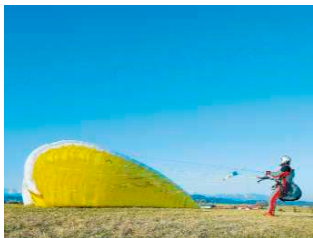
Kurz vor Ende der Zugphase. Mit einem entschlossenen Gehschritt hat sich der Pilot rückwärts in Startrichtung bewegt. Der Oberkörper beugt sich etwas nach hinten. Durch aktives Einsetzen der Hüfte und des Oberkörpers kann so der eine oder andere Schritt rückwärts gespart werden.