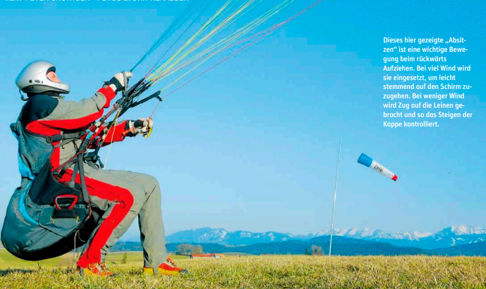
Dieses hier gezeigte „Absitzen“ ist eine wichtige Bewegung beim rückwärts Aufziehen. Bei viel Wind wird sie eingesetzt, um leicht stemmend auf den Schirm zuzugehen. Bei weniger Wind wird Zug auf die Leinen gebracht und so das Steigen der Kappe kontrolliert.

TEXT PETER CRÖNIGER