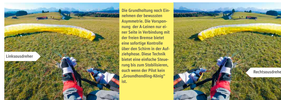
Die Grundhaltung nach Einnehmen der bewussten Asymmetrie. Die Vorspannung der A-Leinen nur einer Seite in Verbindung mit der freien Bremse bietet eine sofortige Kontrolle über den Schirm in der Aufziehphase. Diese Technik bietet eine einfache Steuerung bis zum Stabilisieren, auch wenn der Pilot kein „Groundhandling-König“ ist.

Mit ein bis zwei entschlossenen Gehschritten bewegt sich der Pilot rückwärts in Startrichtung. Der Oberkörper beugt sich etwas nach hinten. Der Zug der A-Leinen wirkt über die Tragegurte auf die Karabiner. Der Zug wird also über den Körper ausgeübt, die locker gestreckte rechte Hand (linke Hand bei Linksausdrehern) hebt die A-Tragegurte etwas nach oben und unterstützt so das Steigen der Kappe. Die Handfläche zeigt dabei nach oben. Der