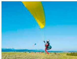
Stabilisierungsphase: der Pilot hat rechtzeitig die Bremsen eingesetzt, um die auf ihn zukommende Kappe abzubremesen. Gleichzeitig macht er ein bis zwei Schritte rückwärts in Startrichtung und steuert so aktiv, dass die Kappe senkrecht über ihm bleibt.