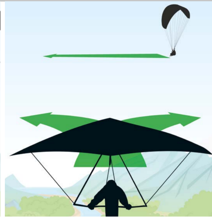
Kreuzender Kurs: Das von links kommende Fluggerät muss ausweichen.