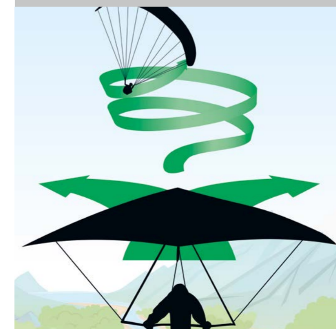
Thermik: Im Aufwind kreisenden Fluggeräten muss ausgewichen werden. Aber: Am Hang haben die Hangflugregeln Vorrang!