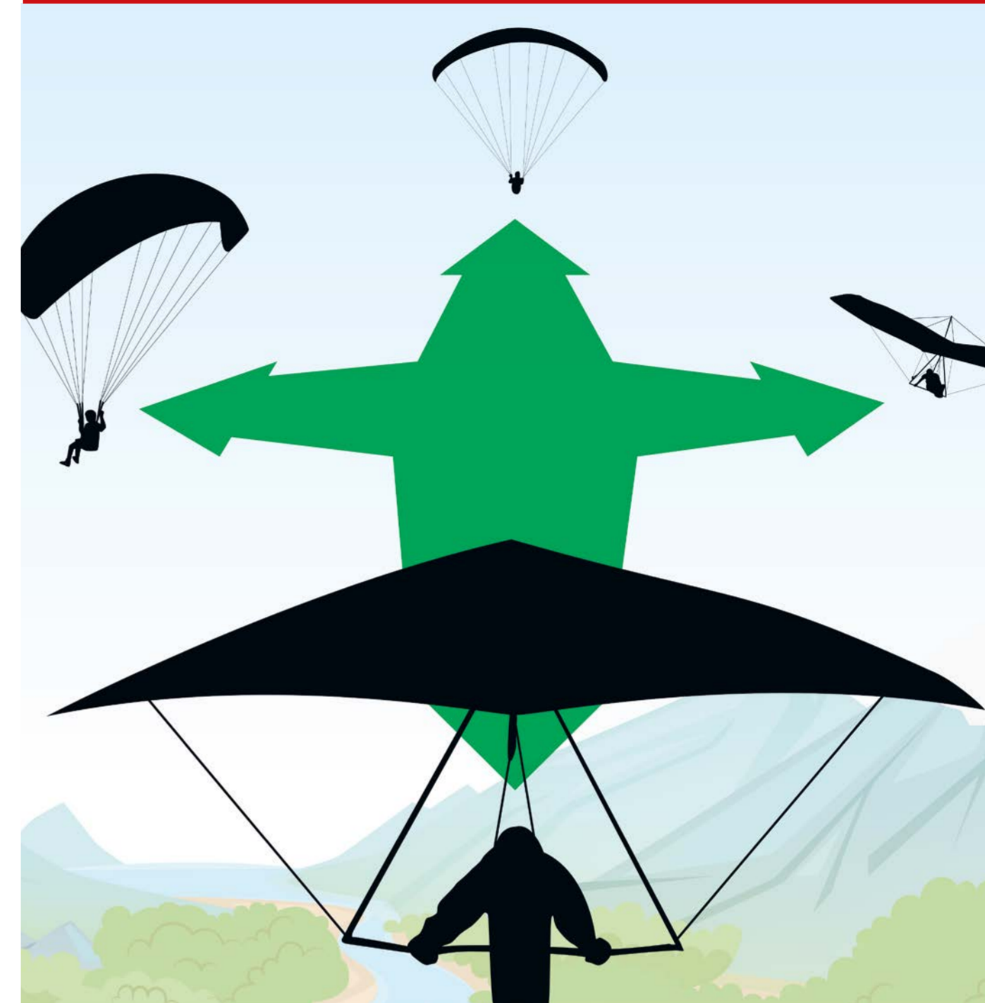
Halte immer sicheren Abstand!