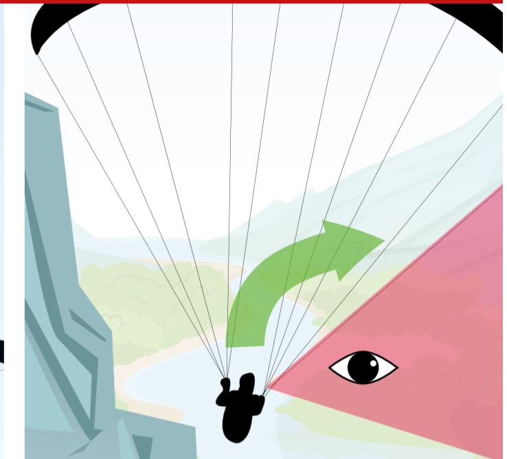
Visueller Check vor jeder Kurve: Keine Kollisionsgefahr im geplanten Flugweg