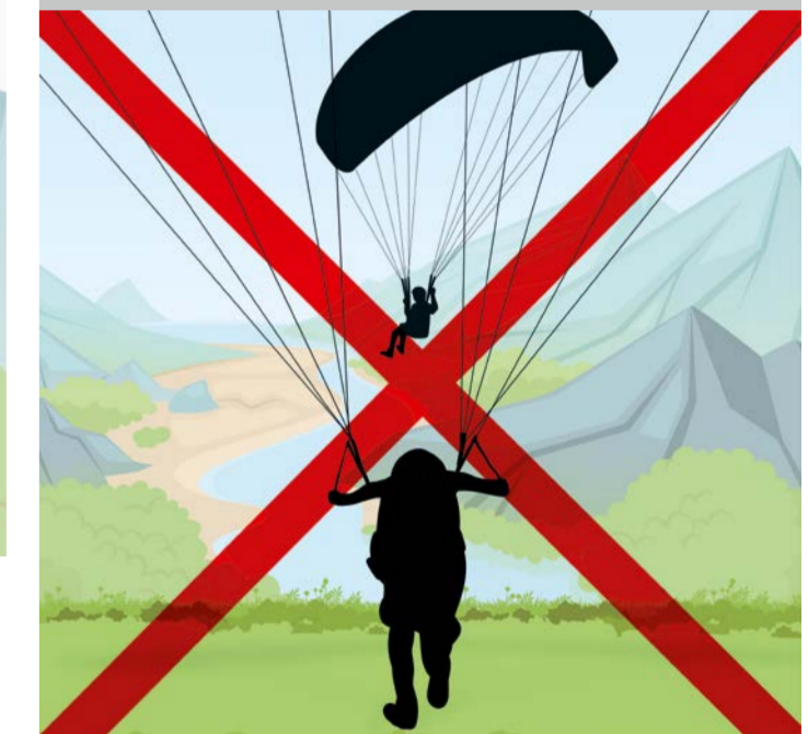
Start: Ein Start darf erst erfolgen, wenn keine Kollisionsgefahr besteht.