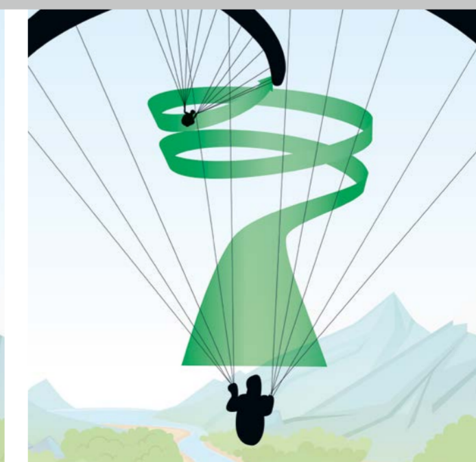
Thermik: Das erste in der Thermik kreisende Fluggerät gibt die Drehrichtung für alle vor.