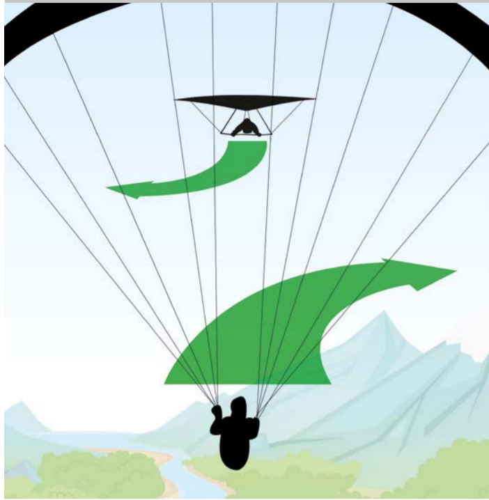
Gegenkurs: Beide Fluggeräte weichen nach rechts aus.