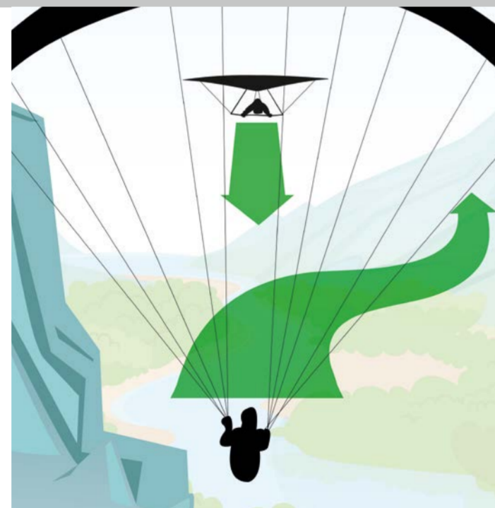
Soaren am Hang: Das Fluggerät mit dem Hang an der linken Seite weicht nach rechts aus.