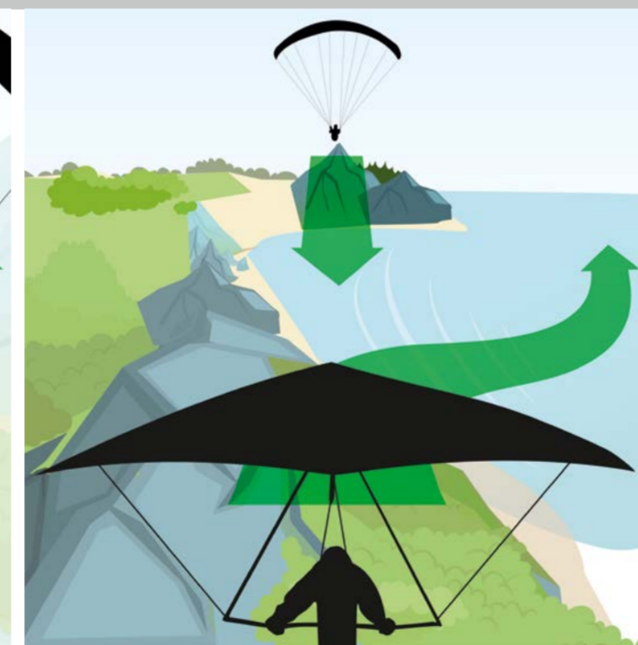
Soaren oberhalb des Hangs: Das Fluggerät mit dem Lee an der linken Seite weicht nach rechts aus