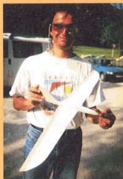
Ferngesteuerter Nurflügler 60 cm Spannweite 63 Gramm Fluggewicht