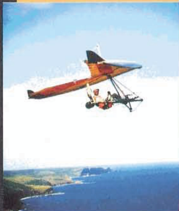
Stanwell Park Drachen mit Cage und Dreieckssteuerung