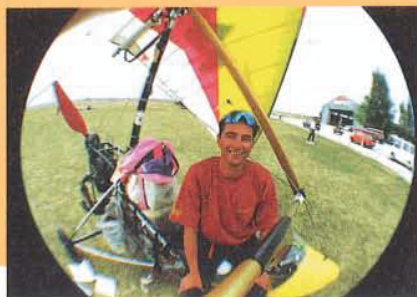
Europameisterschaft Ungarn An- und Abreise mit eigenem Trike