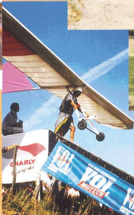
Festival St. Hilaire -The Plank- Vorläufer heutiger Exxtacy und Atos