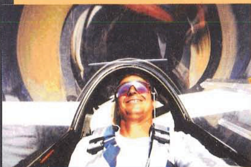
Kunstflug im Segelflieger in Tocumwal/Australien