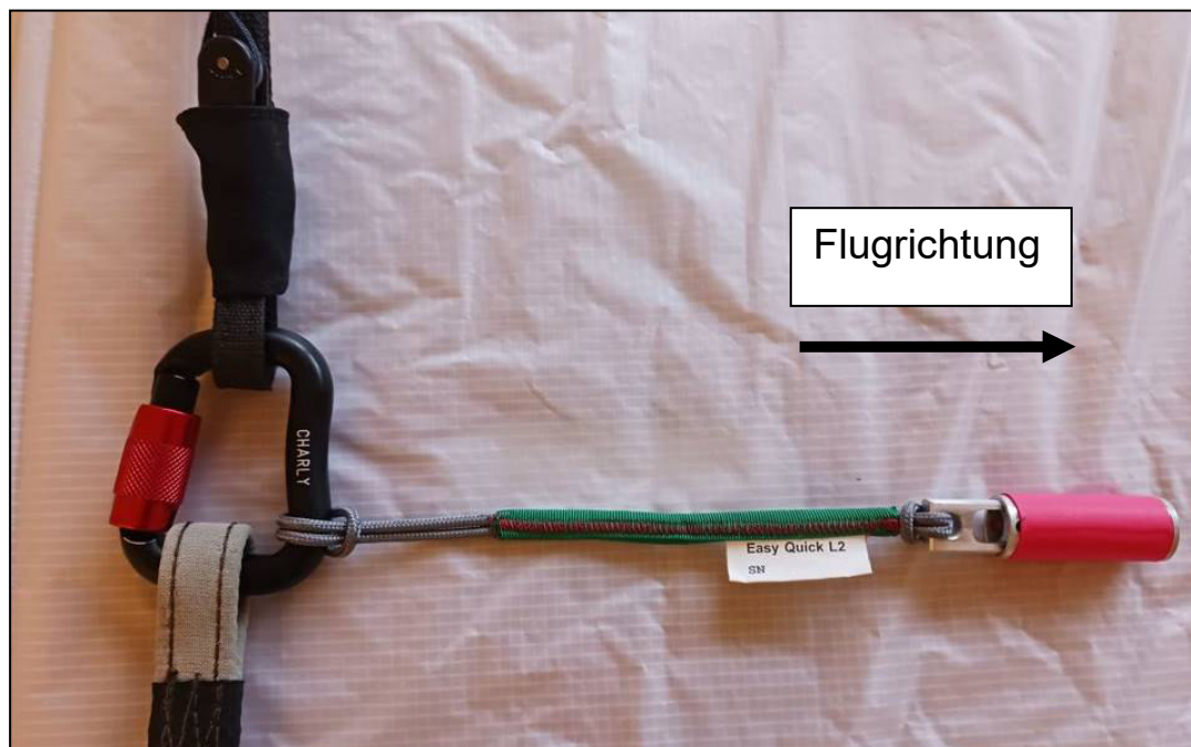
Abbildung 4.1: Detailansicht der Einhängung am linken Karabiner des Passagier-Gurtzeuges Die Nase der Klinke muss Richtung Boden zeigen!

Hierfür werden die beiden Schlaufen der Klinkenhälften in den Karabiner durchgeschlauft (rechter Tragegurt in Abb. 4.1 dargestellt)