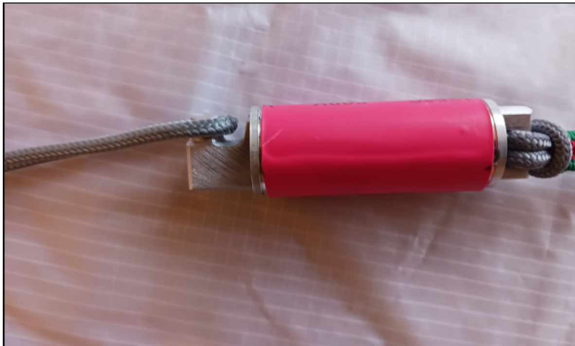
Abbildung 5.2: Einhängen des Befestigungsseils